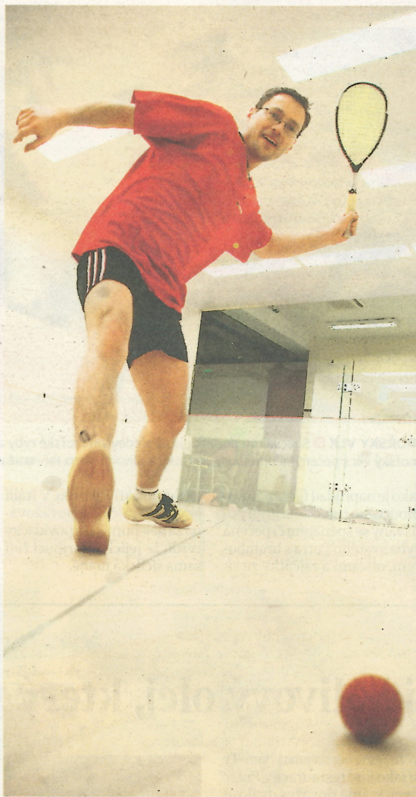
RICOCHET Do Česka dorazil ricochet v devadesátých letech. Přesto tento sport mnoho lidí vůbec nezná.

Již za měsíc se v Praze bude konat turnaj juniorů. V něm se utkají hráči mladší 18 let, přidat se mohou i úplní začátečníci. „Stačí se předem domluvit a zaregistrovat. Nezáleží na zkušenostech, na turnajích je hlavní zábava a radost z pohybu,“ dodává Jan Pulkráb z České ricochetové asociace.